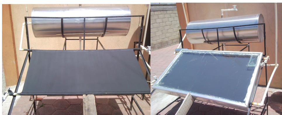
Figura 1. Instalación de los captadores estudiados en dos configuraciones diferentes.

Las pruebas experimentales se desarrollaron en la localidad situada a 19^\circ 30' latitud norte y 90^\circ longitud Oeste en el periodo de enero a junio del 2010, las variables registradas fueron temperatura del agua en la entrada y salida del captador, irradiancia solar, temperatura ambiente y velocidad del viento. Se emplearon termopares tipo K para la medición de temperaturas, un anemómetro modelo Lutron AM-4205 para la velocidad del viento, los datos de irradiancia solar se obtuvieron de 3 estaciones solarimétricas del servicio meteorológico nacional localizadas en la región, además se empleó un solarímetro portátil modelo 776E. Para no tener un efecto significativo en el comportamiento de los captadores con respecto a la velocidad del viento, todas las pruebas fueron efectuadas cuando el anemómetro registraba valores inferiores a 1.5m/s. Sin embargo, con esta velocidad del viento ya se registran pérdidas de calor en los captadores, principalmente en los que no incluyen cubierta transparente. La instalación del sistema solar para las pruebas experimentales se muestra en las figuras 1, que corresponde a al captador de lámina de policarbonato sin aislar y aislado dentro del gabinete.